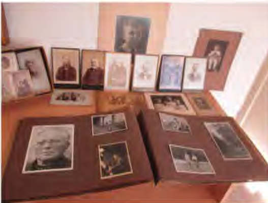
Een klein deel van de aangeboden foto's en een trouwfoto uit 1921

De verzending was snel geregeld en met een goed gevoel dat ook deze foto's weer een goed vervolg hebben gekregen, sluit ik dit artikel af.