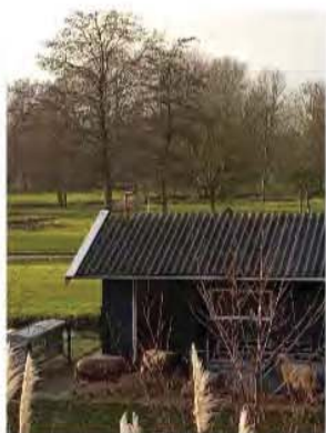
Uitzicht met de schapen