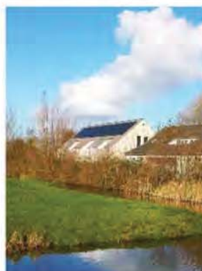
Mijn kamer is in het linkse gebouw bij het middelste balkon