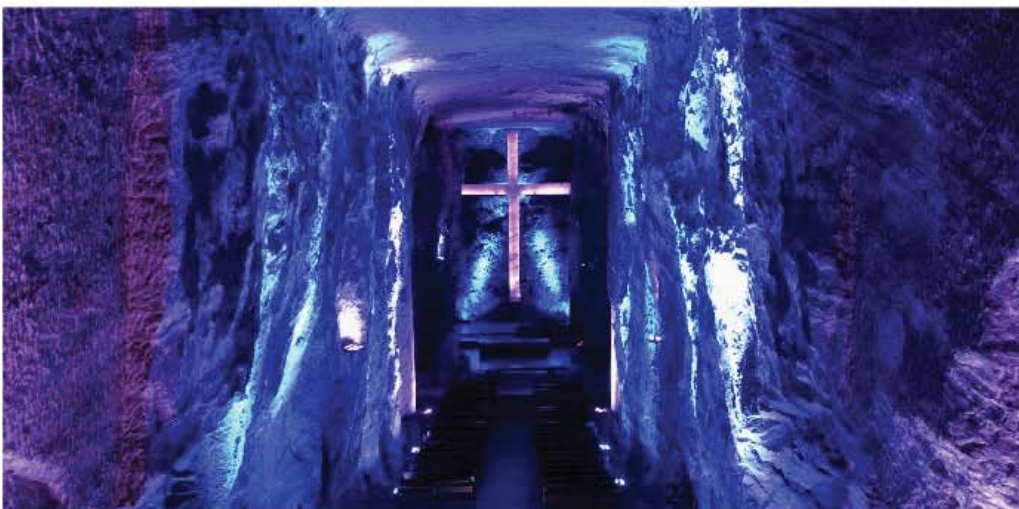
Zoutkathedraal Zipaquirá

Een volgende stap is het oprichten van stichting ZOUT en een bijbehorende vriendenstichting. Stichting ZOUT houdt zich bezig met het organiseren en uitvoeren van de programma's, horeca en de PR die daarbij hoort. De vriendenstichting gaat zich toeleggen op het werven van de benodigde fondsen.